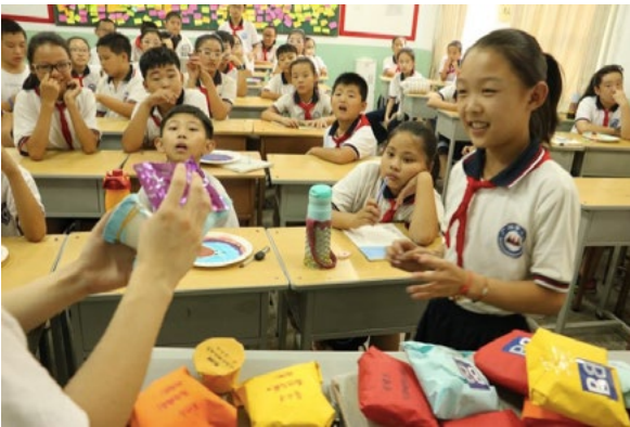
2017BB - 孩子们送的宝贵礼物

诚如在支教过程中，爱心基金会的翁老师反复跟我们说的一句话，“教育不是注满一桶水，而是点燃一把火”。对啊，短期的支教，我们没法把过去学到的知识全部教给我们的学生，但我们可以燃起孩子们对知识的渴望啊！所以此次的洪洞之行，我们不教学校已有课程，而是带孩子们测试职业兴趣、规划人生，教他们打辩论、唱英文歌，跟他们讨论性别平等、性健康知识……所有这些，可能都是他们不曾思考过，甚至从没接触过的。