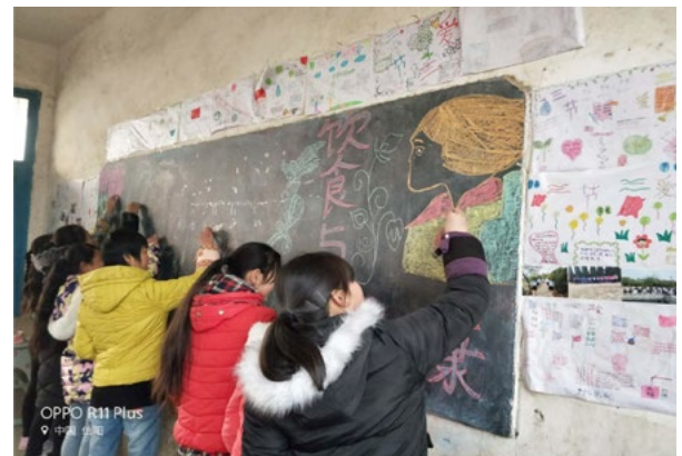
孩子们的食育作品