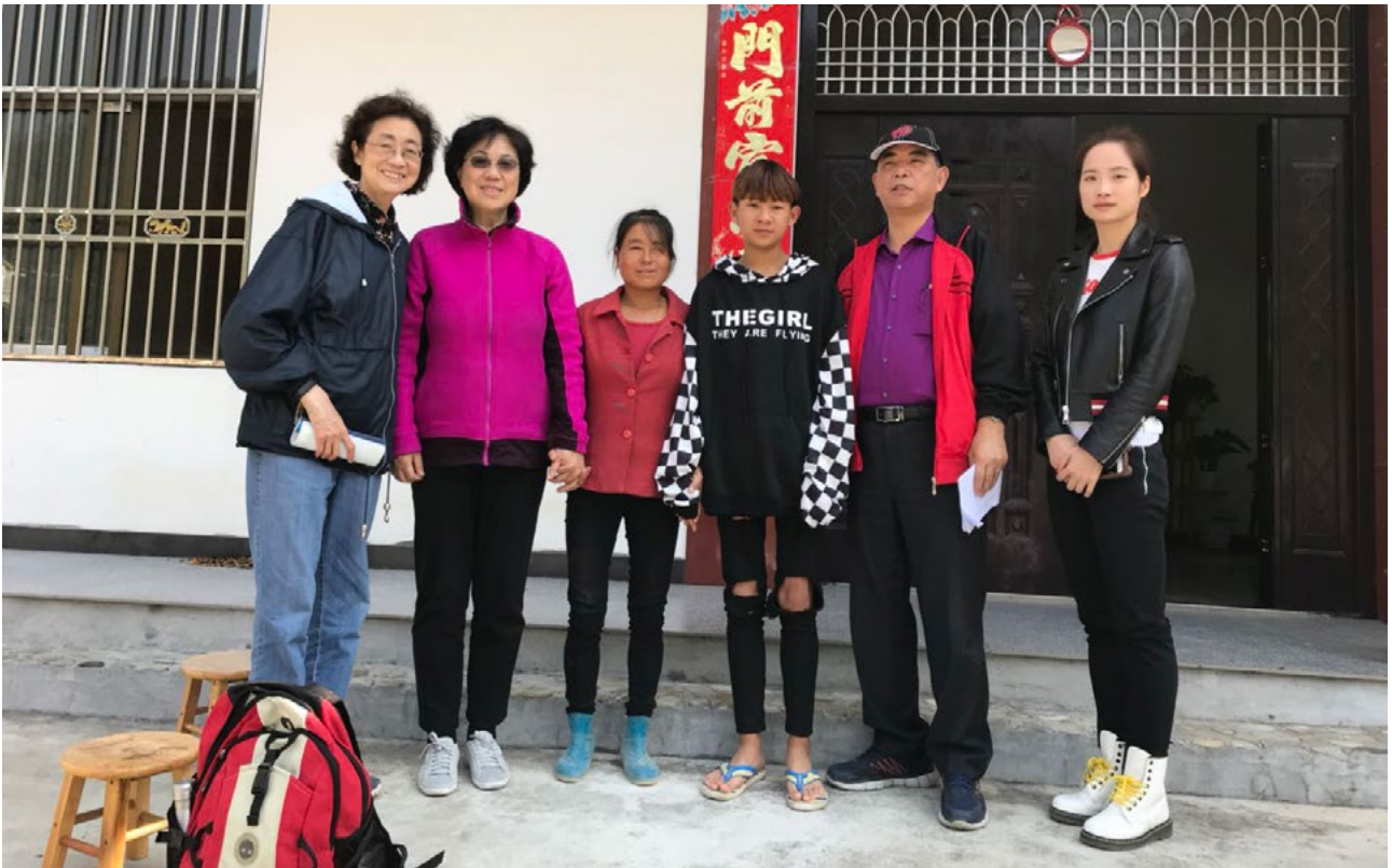
安徽同乡联谊会代表和爱心志愿者与受助学生及家长合影

这也是一种传承，我接受了来自他人的帮助，成长后的我也应以同样的那份心胸去承担责任。因为亲身经历过，我更加明白那种雪中送炭的感动，以及这份感动所带来的巨大力量……。”