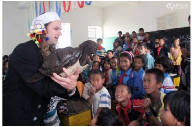
真正的教育，是用一个灵魂去唤醒另一个灵魂