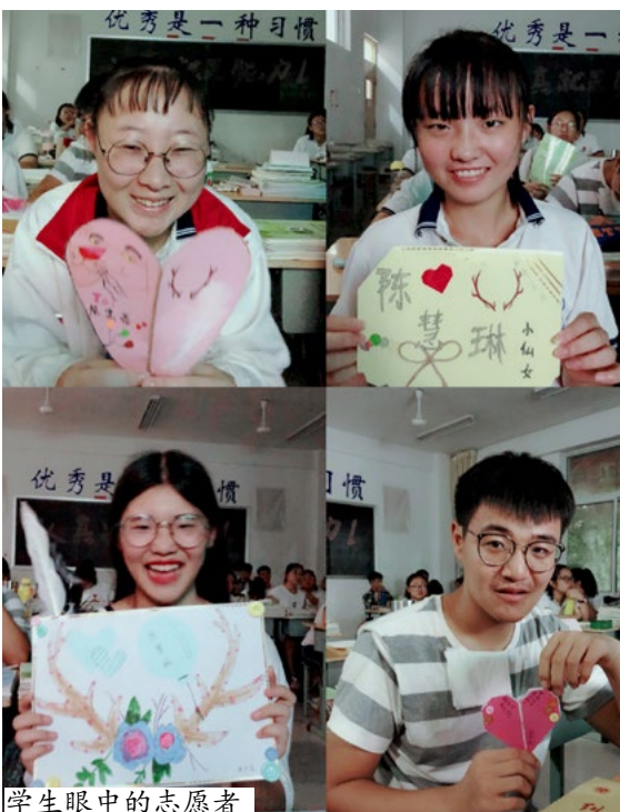
学生眼中的志愿者