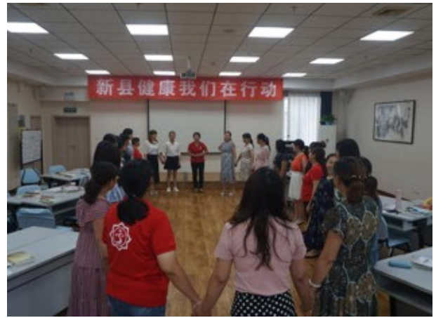
妇女骨干能力建设培训

发放健康知识读本，宣讲健康小知识，以家庭的视角呈现了健康促进在个人、家庭以及社区的重要性。她们还在项目村开展了健康安全培训、亲子趣味运动会、与文艺骨干座谈研讨剧本，指导文艺骨干排练健康小话剧、重阳节健康敬老活动、健康厨艺大赛、健康知识讲座等。这些活动大多是当地妇女姐妹在益创乡村女性的老师们指导下，自己设计、筹划和组织的，虽然付出了很多，也很辛苦，但锻炼了这些乡村姐妹的组织能力和沟通协调能力。通过参与健康促进各种活动，使这些农村妇女由昔日的健康知识被动接受者，转变为现在的主动传播者。“益创”还帮助建立了“新县健康姐妹社群”，开展线上课程。每个月两次的线上课程信息会及时推送到群里。微课内容不仅有健康知识方面的，还有乡村女性比较关注的亲子家庭教育、如何穿衣、如何化妆等多方面知识，社区分享课每次会邀请成熟项目点的负责人和大家一起分享组织活动的流程、如何链接资源等方面内容。通过这些活动，传播了先进健康理念，提高了居民的健康素质和生活质量，在社区营造了人人关注健康、人人懂得健康、人人维护健康的氛围，受到了广大居民的欢迎。