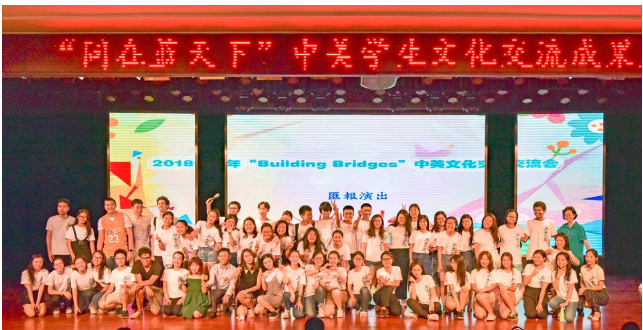
2018 BB- 汇报演出

在模拟谈判课上，学生们发言十分积极，不难看出他们的思维是非常活跃的。他们中有不少学生很聪明，但是他们需要更宽松一些的环境，需要更多一些自我表达的机会。这样，他们的创造力和想象力就可以爆发出来了。由此可见，可造之材并不缺乏，缺的是造才之机。