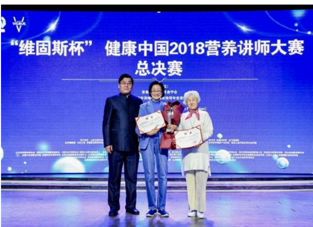
爱心基金会代表在2018健康中国营养讲师大赛上