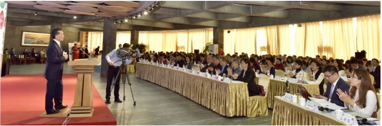
2018年3月举办食育国际研讨会

益组织和专业机构的指导和支持下，将中小学的食育放在与德育与智育体育同等的位置，持续地开展学校实践，不断提升食育教育师资力量，形成了以食育促进健康生活的新风尚。