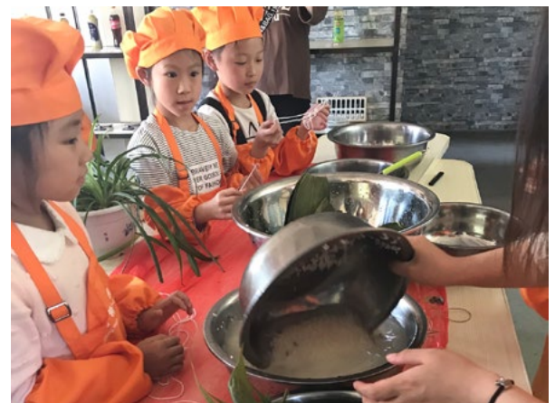
食育实操课上包粽子