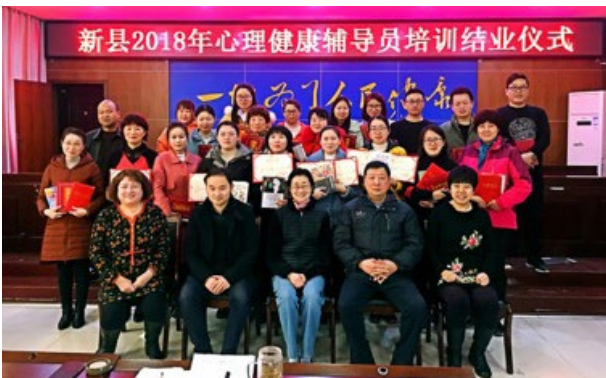
心理健康辅导员专业培训结业

爱心基金会一直密切关注中国基层、特别是农村地区的民众心理健康问题。自 2005 年以来，爱