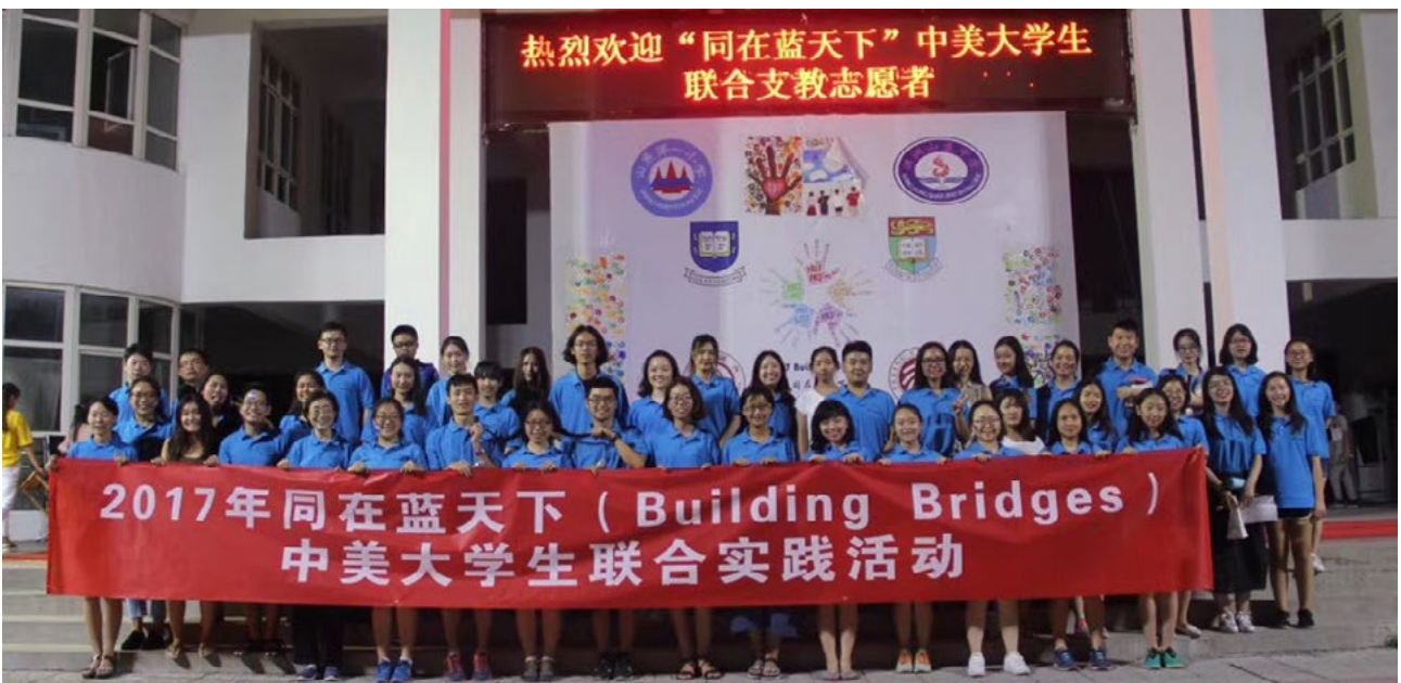
2017BB - 全体志愿者合影

上课之前，我遍访我的学习各个专业的同学，也上网查了资料，先自己跟这些五花八门的专业熟络起来。