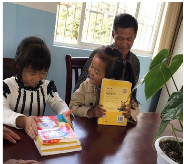
石台受助小学生得到捐赠的新书喜笑颜开

为了不给学生增加负担，不让学生在老师逼迫下写信，我们一直以来的原则是鼓励学生给资助人写信，但不强行要求。我们给受助学生提供北京爱心基金会地址，并承诺会帮学生转达信件。每年通过爱心助学项目资助的学生约两三百名，我们每年大约会收到一百多封来自受助学生给资助人的感谢信；因为我们没有