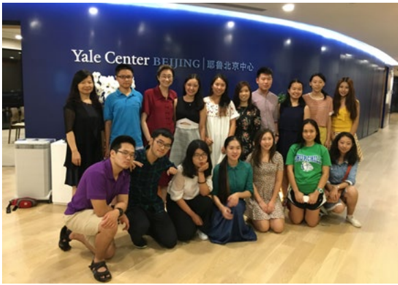
2017BB - 北京耶鲁中心分享会

画的思维导图，是他们在一种新的视角下的思考；我看到了志愿者们和学生一对一地谈心，学生们把平时不敢和高中老师说的，心里的困惑向志愿者们倾诉。